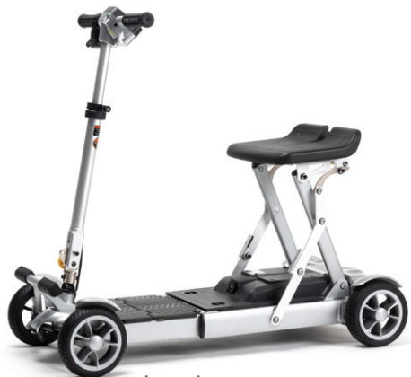
version gris argent avec batterie de 17,4 Ah