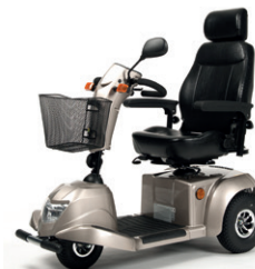
CERES 3 DELUXE