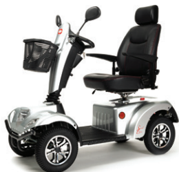
CARPO 2 SE