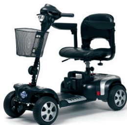
VENUS 4 SPORT (pneus bandages)