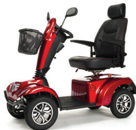
CARPO 2 XD SE