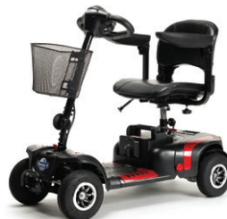
VENUS 4 SPORT (pneus gonflables)