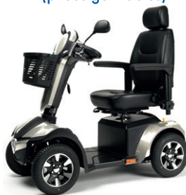
MERCURIUS 4 LE

Pour plus d'informations contactez votre revendeur :