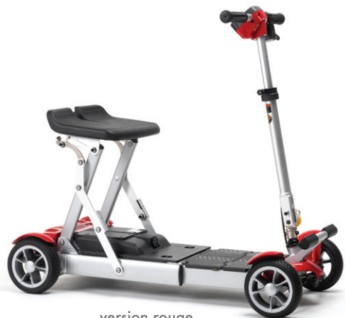
version rouge avec batterie de 11,6 Ah