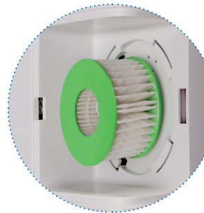
Filtre à air (situé derrière le couvercle)