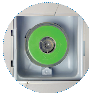
Filtre à air (situé derrière le couvercle)