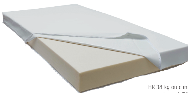
HR 38 kg ou clinique houssé PVC M1

Conditionnement pour toutes les références sauf 411020 C : Cartons de regroupement : 1 pc. Palette : 8 pc.