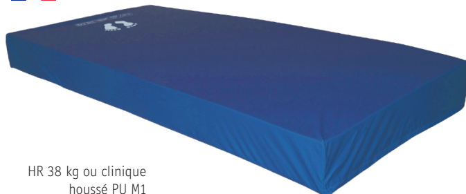
HR 38 kg ou clinique houssé PU M1