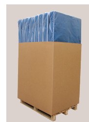
Palette standard 8pcs