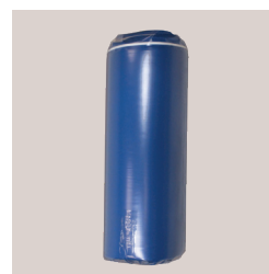
Matelas comprimé HR