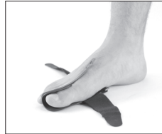
Figure / Figura 2